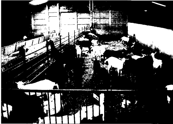
CHEVRETTES D'ÉLEVAGE : ATTENTION AU SEVRAGE

Période délicate à conduire le sevrage des chevrettes et leur élevage jusqu'à la saillie conditionne en partie les performances laitières ultérieures. Ce deuxième article fait le point sur les meilleures stratégies alimentaires.