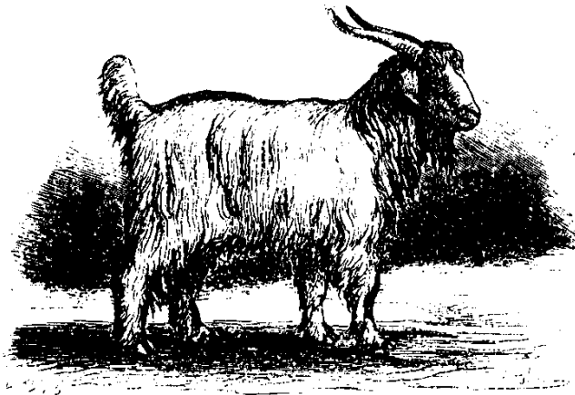
Chèvre du Thibet.

BENION (A.)- LA CHEVRE; ASSELIN, PARIS (1878).